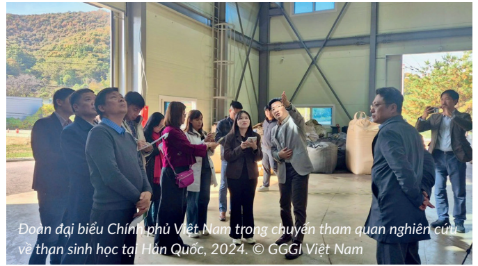
Đoàn đại biểu Chính phủ Việt Nam trong chuyến tham quan nghiên cứu về than sinh học tại Hàn Quốc, 2024.

Giảm phát thải khí mê-tan là trọng tâm trong mục tiêu đạt phát thải ròng bằng 0 của Việt Nam vào năm 2050. Từ năm 2024, GGGI đã hợp tác với Bộ Nông nghiệp và Môi trường thông qua ba dự án chính, nhằm hỗ trợ các sáng kiến nông nghiệp các-bon thấp của Việt Nam tại Đồng bằng sông Cửu Long. Những nỗ lực chung này nhằm 1) Xây dựng nền tảng vững chắc cho việc giảm phát thải khí mê-tan trên quy mô lớn, tập trung vào nâng cao năng lực thể chế, đo lường phát thải và áp dụng tài chính hỗn hợp; 2) Tăng cường năng lực và cơ sở chính sách phục vụ chuyển đổi nông nghiệp xanh và phát thải thấp; 3) Thúc đẩy áp dụng than sinh học tại Việt Nam.